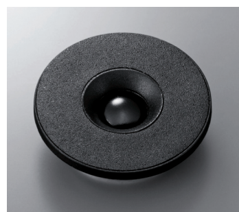
Tweeter à dôme