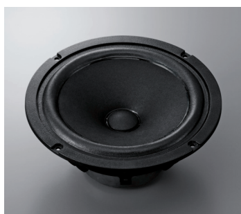
Woofer « waterproof »