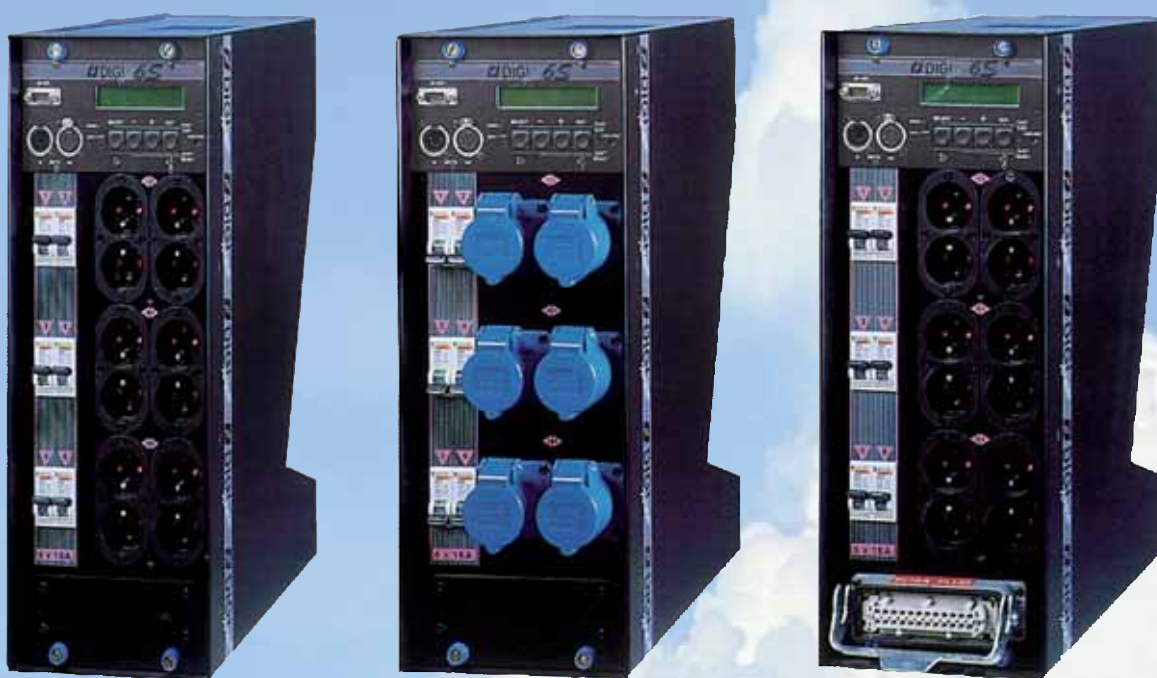
DIGITOUR 6 x 16A N.F.

DIGITOUR 6 / DIGITOUR 6S 6 x 16A / 3 x 25A / 1 x 50A