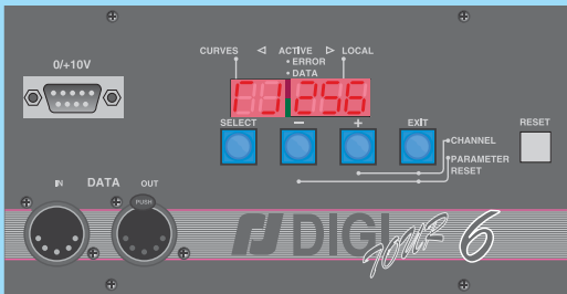
TABLEAU DE BORD / CONTROL PANEL - DIGITOUR 6 S.